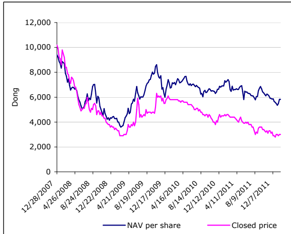
Biểu đồ so sánh NAV và giá thị trường