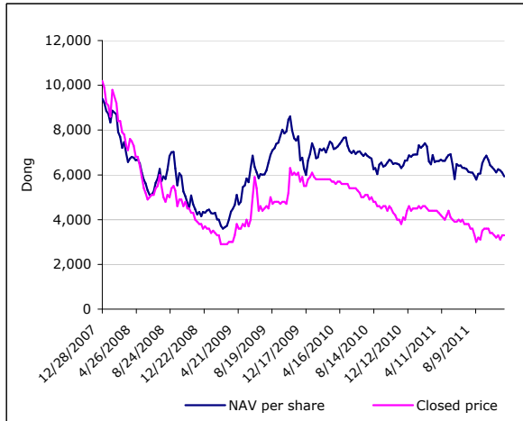
Biểu đồ so sánh NAV và giá thị trường