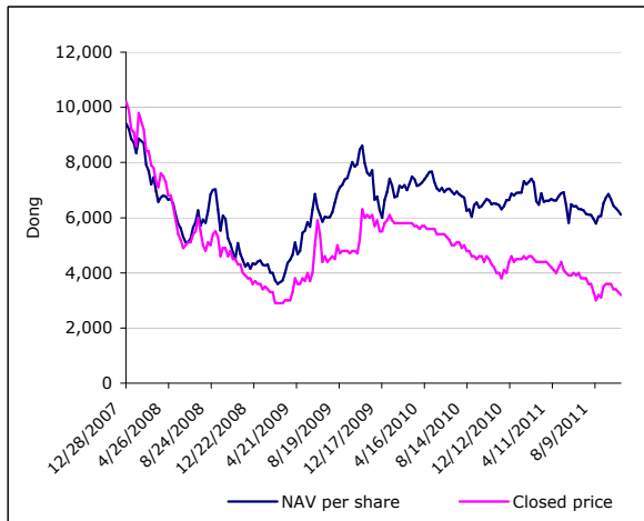
Biểu đồ so sánh NAV và giá thị trường