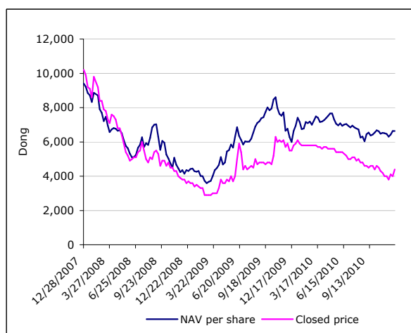
Biểu đồ so sánh NAV và giá thị trường