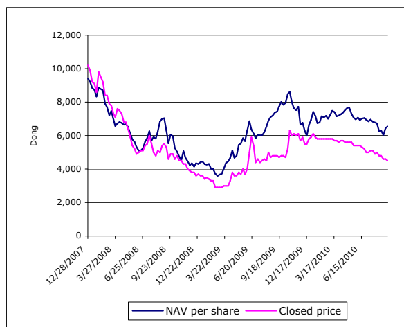
Biểu đồ so sánh NAV và giá thị trường