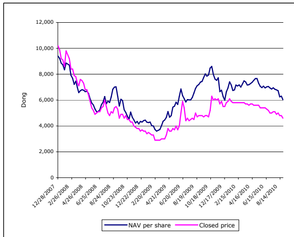
Biểu đồ so sánh NAV và giá thị trường