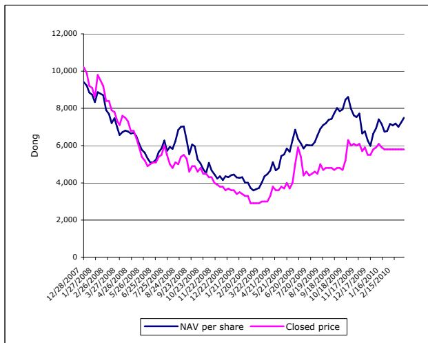
Biểu đồ so sánh NAV và giá thị trường