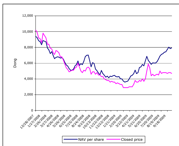
Biểu đồ so sánh NAV và giá thị trường