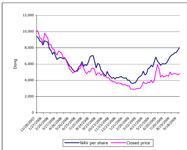
Biểu đồ so sánh NAV và giá thị trường