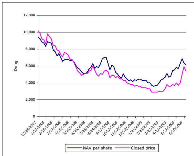
Biểu đồ so sánh NAV và giá thị trường