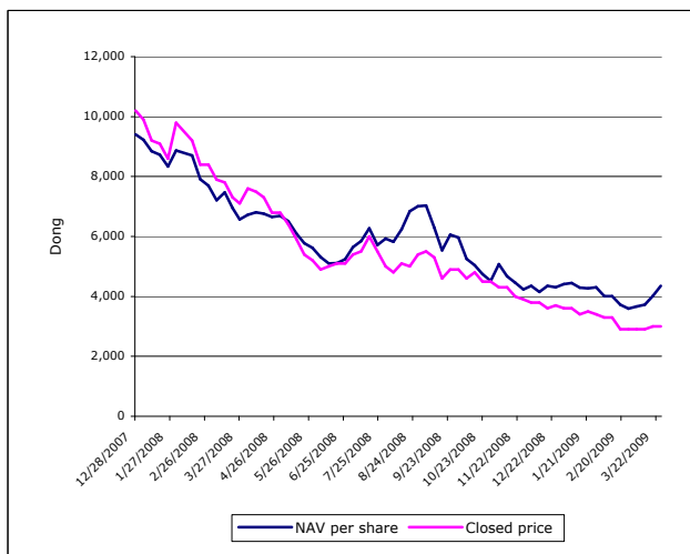
Biểu đồ so sánh NAV và giá thị trường